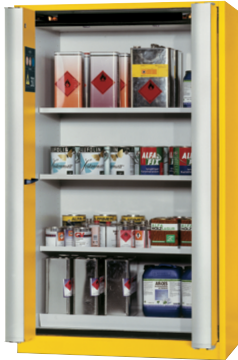
Armarios de seguridad S-PHOENIX-30 modelo S30.197.120 amarillo seguridad (RAL 1004) con sistema de bloqueo de puertas, 3 bandejas, bandeja perforada y cubeto de retención (plancha de acero plastificada) Referencia 30174-002-30177