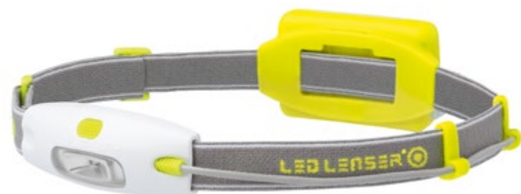
LED LENSER® NEO NEÓN AMARILLO: Art. n° 6114