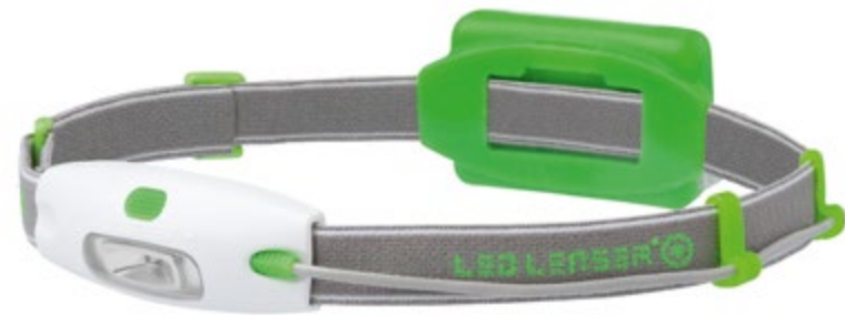
LED LENSER® NEO NEÓN VERDE: Artículo n° 6111