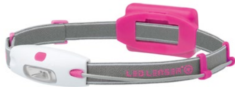
LED LENSER® NEO NEÓN FUCSIA: Art. n° 6112