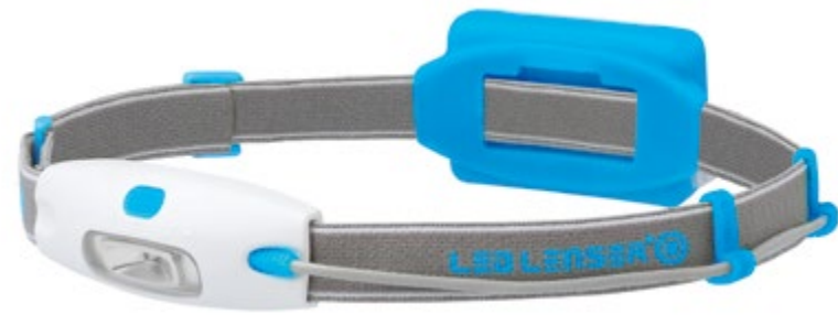
LED LENSER® NEO NEÓN AZUL: Art. n° 6110