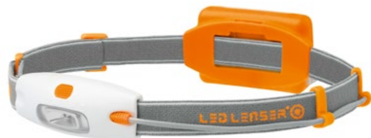
LED LENSER® NEO NEÓN NARANJA: Artículo n° 6113